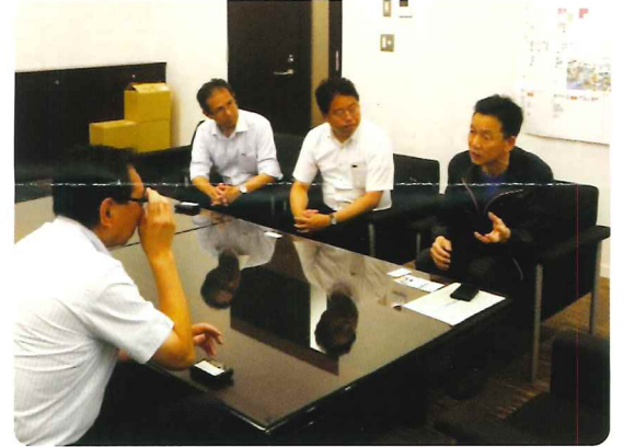
▲石川県輪島市で副市長と懇談

また総務常任委員会では、兵庫県知事のパワハラ問題を受け、府職員のハラスメント防止対応について相談件数を確認。ハラスメントのない快適な職場環境に向け、あらゆる方策を講じていくよう要望しました。